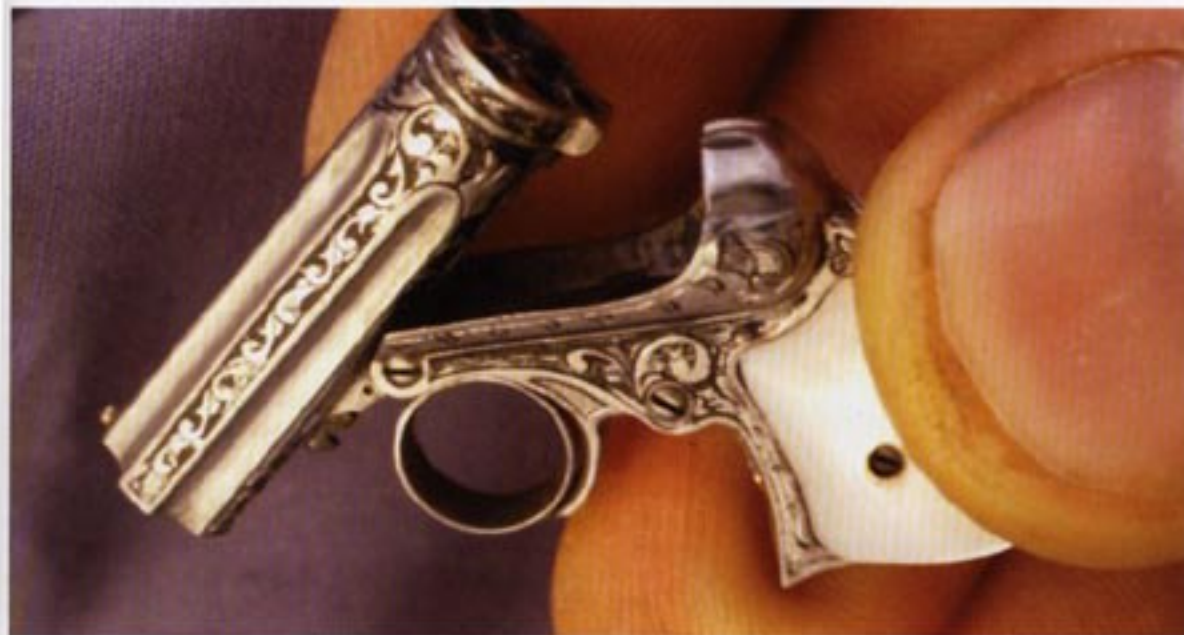
Remington-Drummond, à l'échelle de 1/3